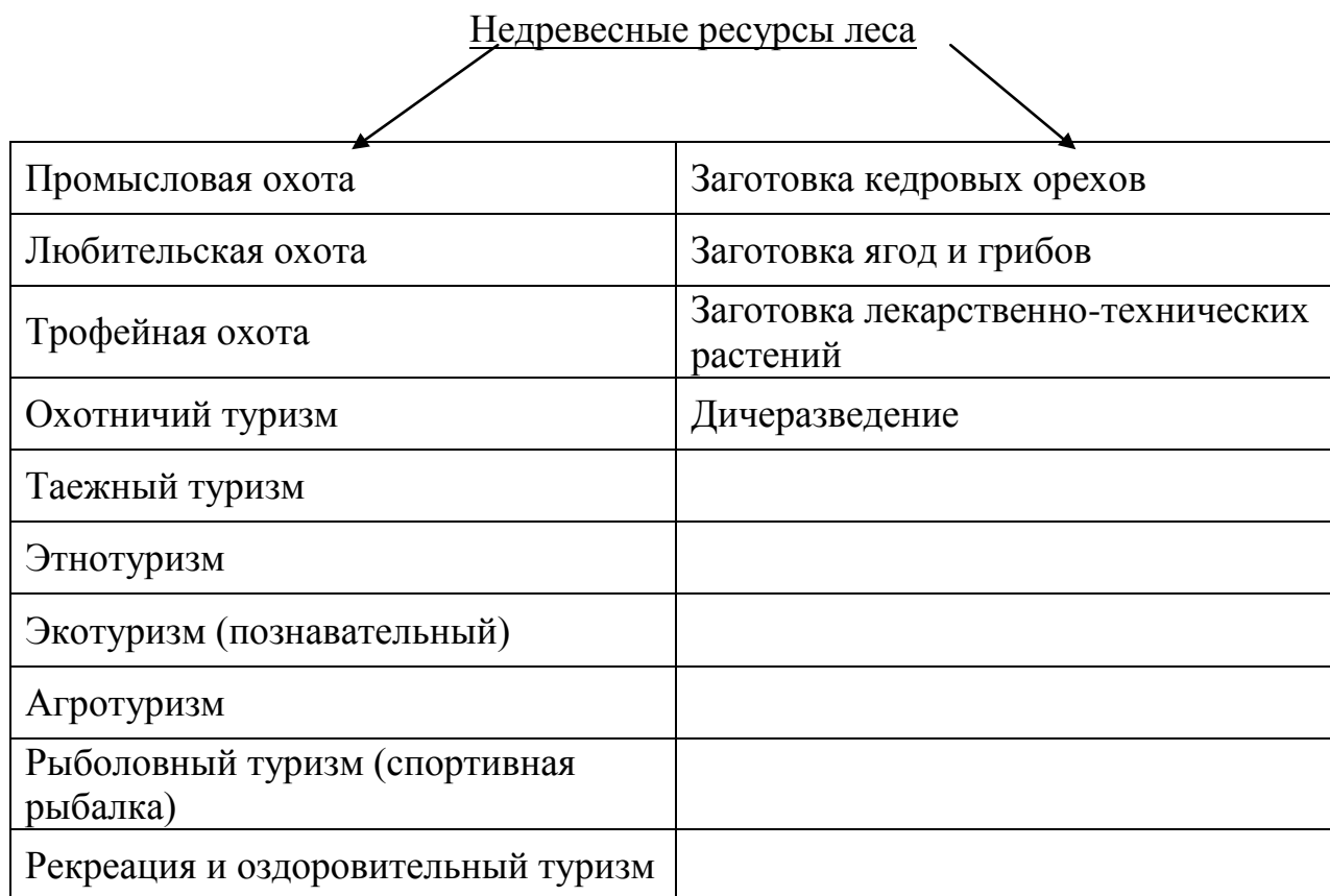
Рис. 1 Недревесные ресурсы леса

года [6, 7], мы предлагаем следующую схему районирования ресурсов охотничьего хозяйства и недревесной продукции леса для создания отрасли биосферного природопользования.