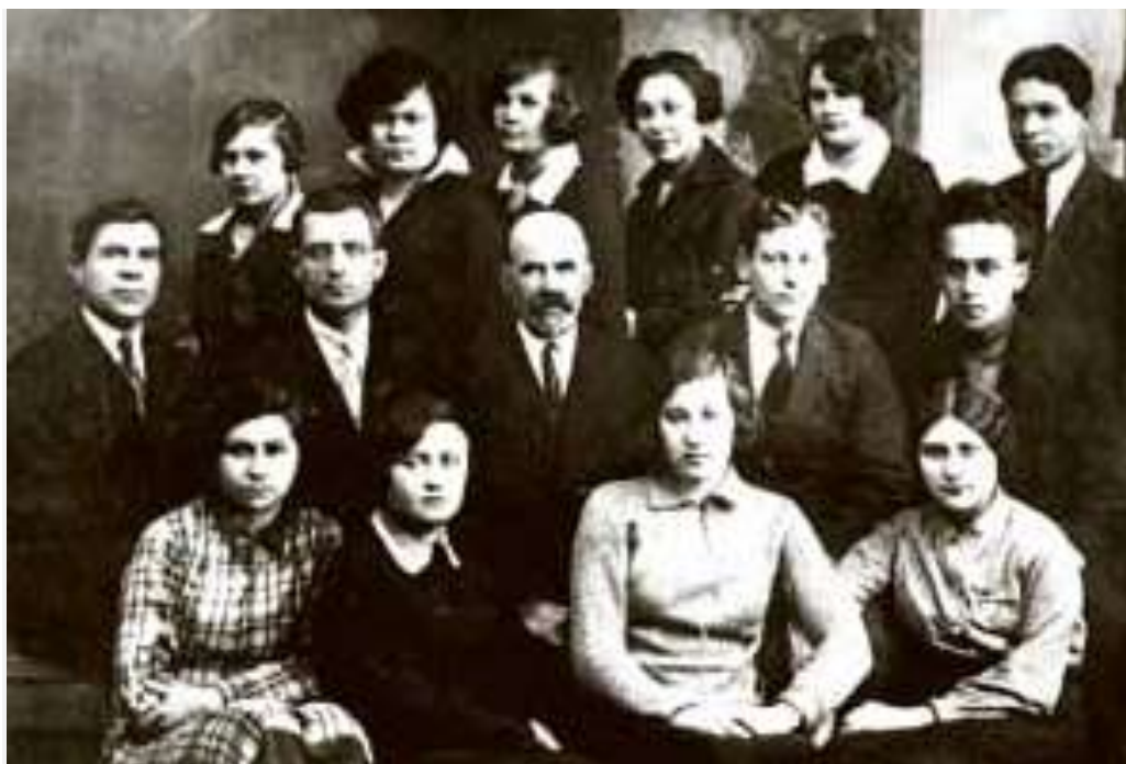
Рис. 3 - В.Ч.Дорогостайский с первым выпуском зоологов.

В.Ч. с юных лет увлекался охотой и был метким стрелком. Объекты охоты были для него предметами исследования на протяжении всей жизни. Им он посвятил девять научных работ, не считая пропавших рукописных книг [6] «Промысловая фауна Восточной Сибири» и «Птицы Прибайкалья», где были подведены итоги многолетних исследований промысловой фауны и орнитофауны Иркутской области.